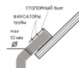
Схема крепления / подключения