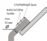
Схема крепления / подключения